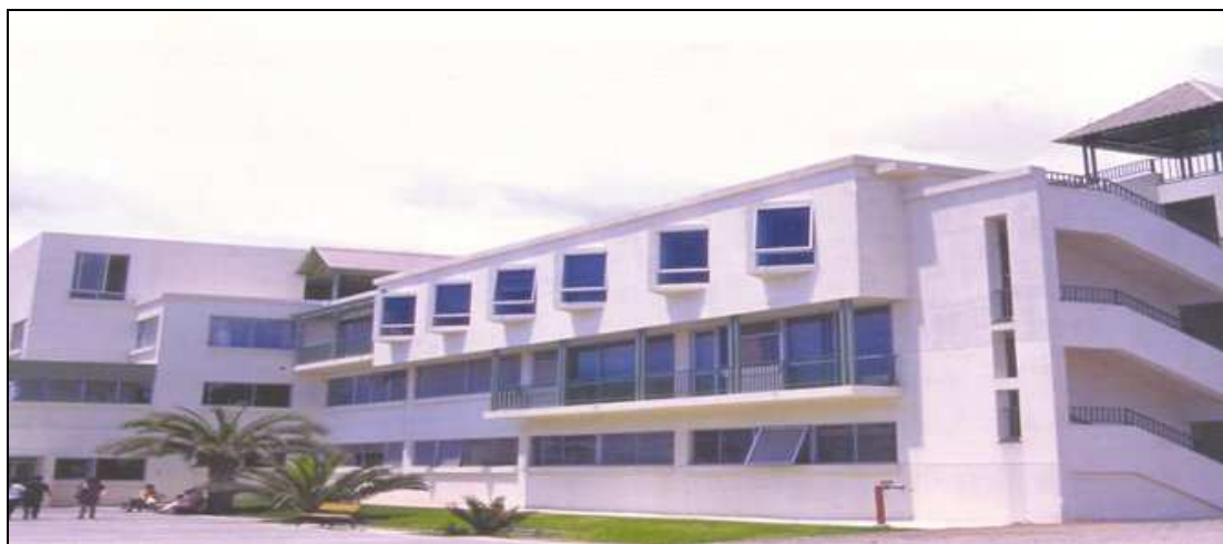
Nuevo Hospital de Iquique

La tercera etapa finalizó el 18 de diciembre de 1995, con la alegría de sus funcionarios por trabajar en un ambiente moderno, con nuevas tecnologías y equipamiento, cuyo objetivo principal es la eficiente atención de los pacientes.