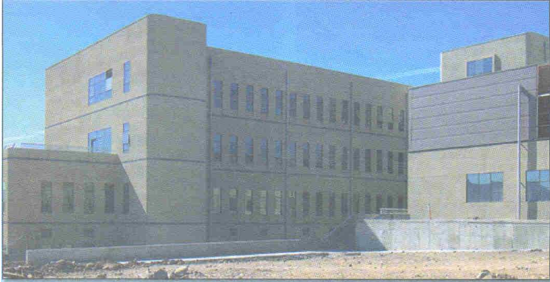
Hospital Provincial del Huasco "Monseñor Fernando Ariztía Ruiz"

El nuevo Hospital Provincial del Huasco "Monseñor Fernando Ariztía Ruiz" es un cambio para el desarrollo de la salud pública del Valle del Huasco. Su infraestructura, que es considerada como una verdadera clínica, posee una superficie construida de 17.080 metros cuadrados, tres veces más grande que el "Hospital Nicolás Naranjo"