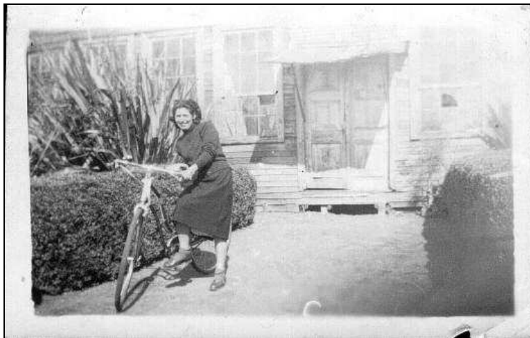
Frontis del Antiguo Hospital

territorios: Gobernación, Tribunales de Justicia, Registro Civil, Hospital, Establecimientos Educativos.