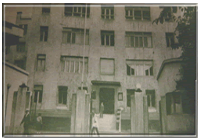
Entrada Principal del Hospital de Carabineros en el año 1961