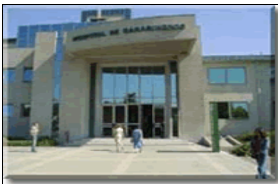
Entrada Principal al Policlínico