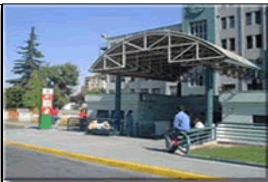
Servicio de Urgencia