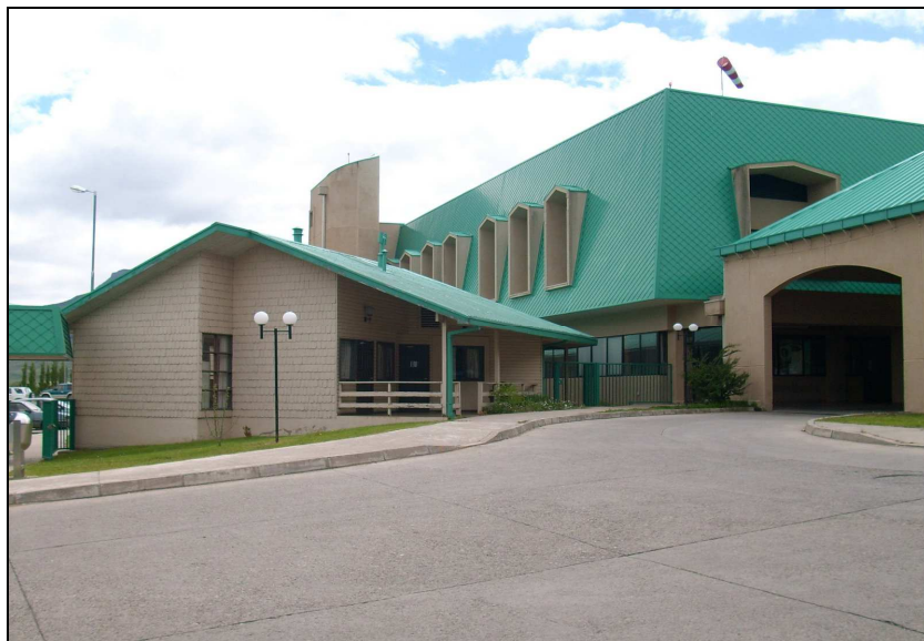
Hospital Regional de Coyhaique

El Hospital Regional Coyhaique, es el Centro de Referencia en atención de Salud en la región. Es un Hospital Tipo 2 y es el centro de derivación para el resto de los hospitales de la región, con una dotación de 172 camas.