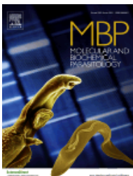
Molecular and Biochemical Parasitology