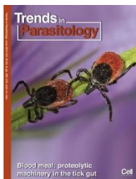
Trends in Parasitology