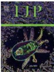
International Journal for Parasitology